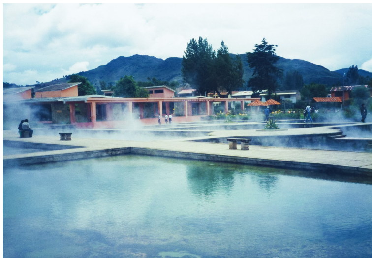
図2 インカの温泉の冷却プール 。